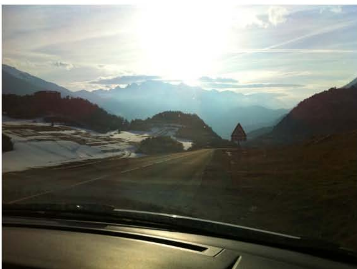
Photo 2011 sortie du village

A la fin de notre observation les deux sphères ont disparus de notre champ de vision simultanément et instantanément sans bruit, sans odeur, avec un léger changement de couleur extérieur pour la plus proche un halo gris vert doux à l'étape 2, nous sommes remonté dans notre voiture nous avons fait demi tour et nous sommes partie dîner au restaurant