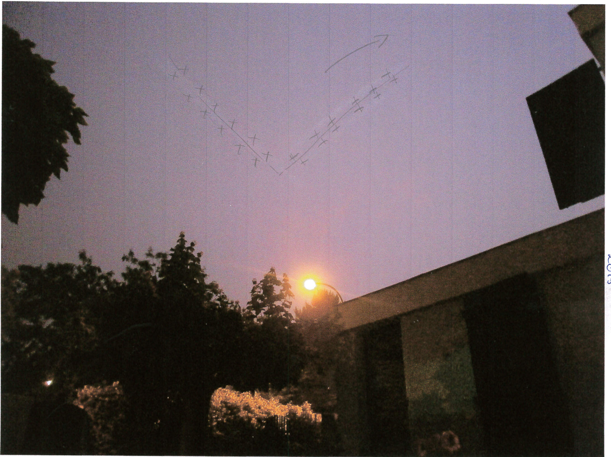
Photo prise depuis mon jardin le 3 Juin au soir. 2015