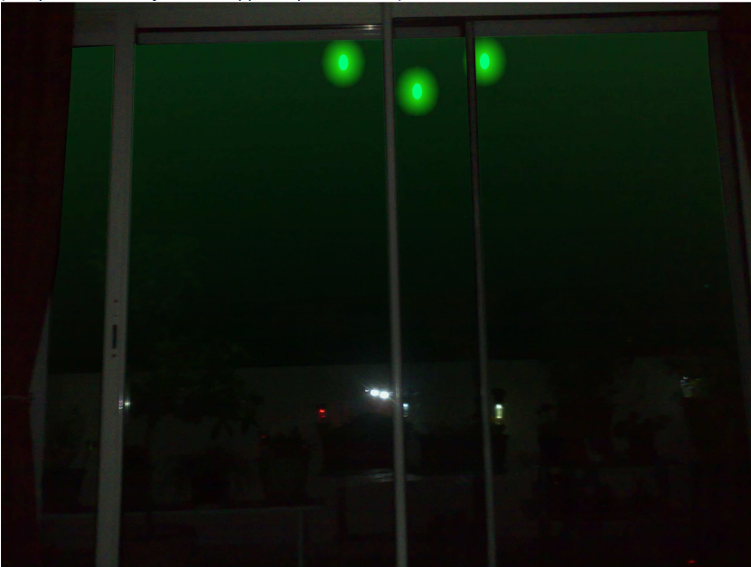
1 Apparition au-dessus de ma terrasse

(Lampes solaires et flash de l'appareil photo en bas)