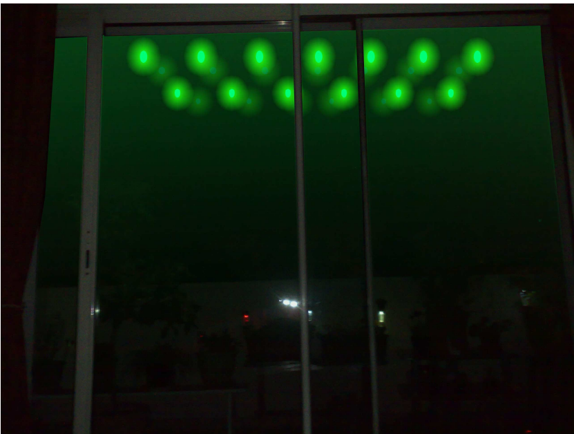
2 Passage entre les 2 immeubles, éloignement et disparition