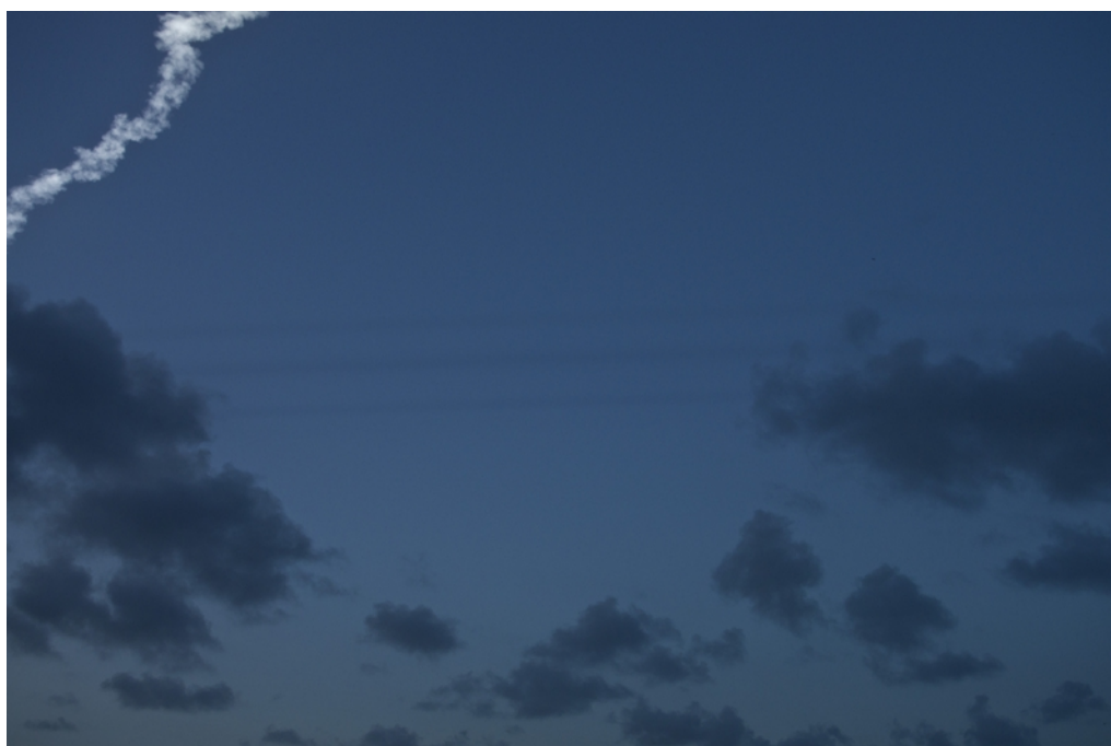
On commence à les distinguer