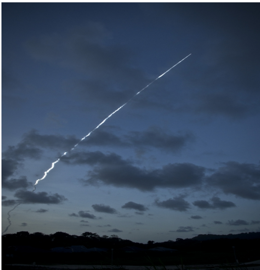
Vue panoramique du décollage de la fusée, on ne distingue pas encore les lignes