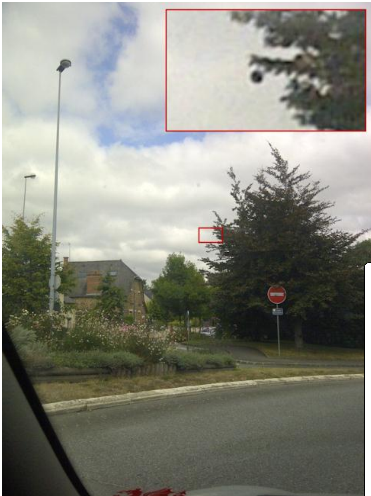
4.1. Croquis du phénomène et de l'environnement