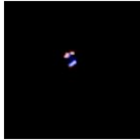
Extrait de ma vidéo

Utilisez cette page pour dessiner votre observation. Vous êtes entièrement libre de l'élaboration de ce croquis.