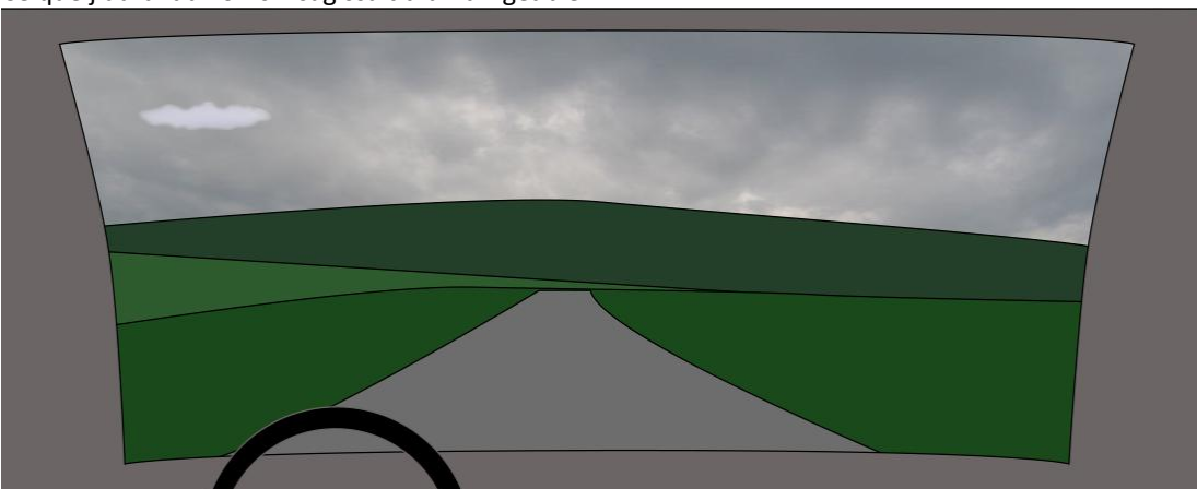
Ou encore si cela avait été un nuage ou un espace plus clair dans le ciel.