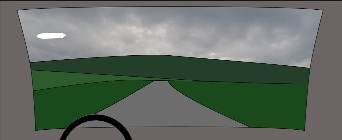
Voici un dessin de ce que j'ai observé