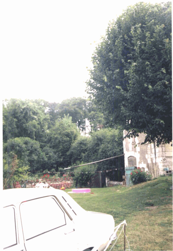
P3 : idem P2