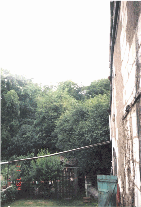
P5 : Idem P4