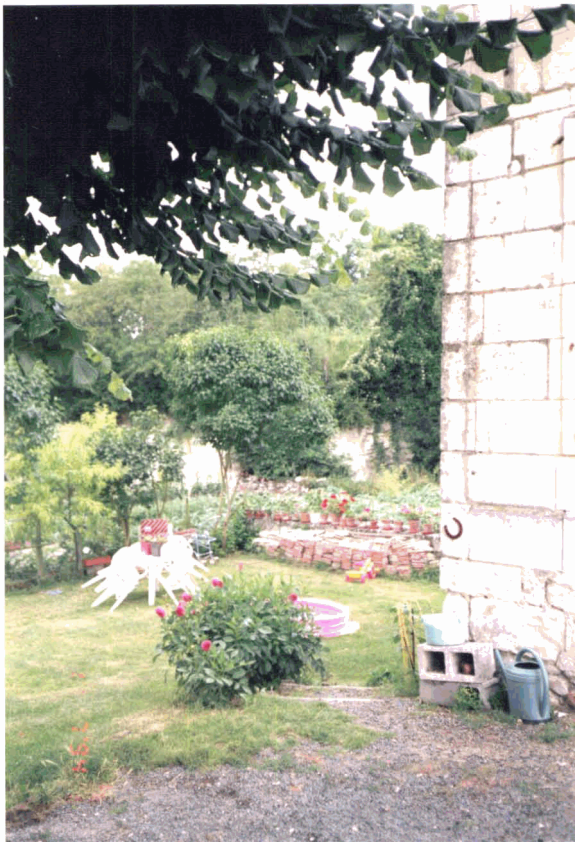
P2 : Lieu précis où se trouvaient Mlle L. et G