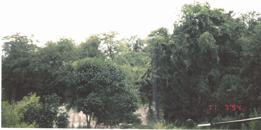
P4 : Vue du ciel où a été vu l'O.V.N.I.