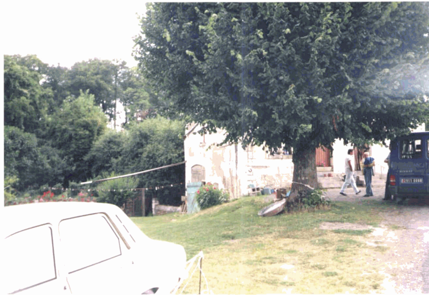
Photographie 1 (P1) : Maison de L " " commune