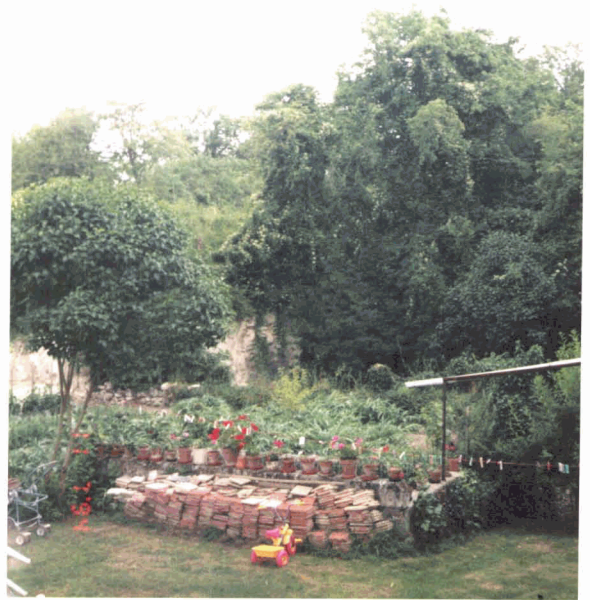
P6 : Idem P4