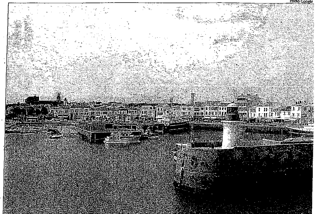
Deux hommes disent avoir aperçu d'étranges boules lumineuses dans le ciel de l'île d'Yeu, samedi dernier.

pilote de la société de transports Oya hélicoptères, rendait son tablier samedi soir au moment où les boules auraient été aperçues dans le ciel. « On travaille jusqu'au coucher du soleil. Samedi dernier, j'ai terminé à 21 h 55 heure locale. Mais je n'ai rien vu dans le ciel » indique, catégorique, le pilote.