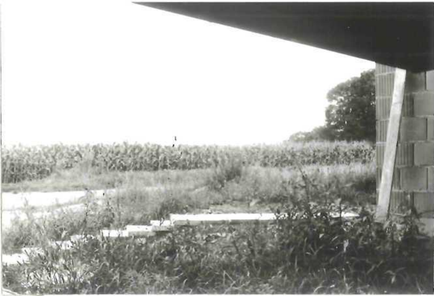
Prise de vue sur le lieu- dit " " du sous sol de la maison de Monsieur S , A .