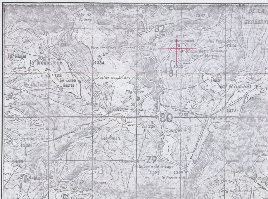
Extrait de la carte au 1/50 000° FEUILLE XXVI - 36 SAUGUES