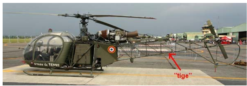
Figure 3 : exemple d'hélicoptère en position oblique et arrière (« tige ») d'une Alouette-II