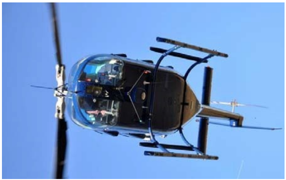
Figure 1 : comparaison vue de dessous du PAN (dessin témoin) avec un dessous d'hélicoptère.

Cette hypothèse envisageable est confortée par la présence de l'autoroute jamais évoquée par le témoin, actuellement appelée « La Languedocienne » (première ouverture en 1967, dernier tronçon 1976) dans la zone d'observation du PAN (Figure 2 : cartographie des lieux).