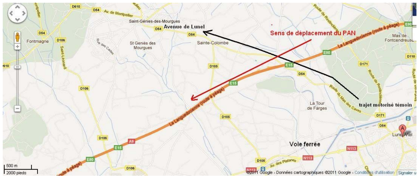
Figure 2 : cartographie des lieux

Les mouvements décrits du PAN (direction Sud-Ouest correspondant à l'axe de l'autoroute, capacité de vol stationnaire ) sont compatibles avec un vol d'hélicoptère suivant l'axe de l'autoroute.