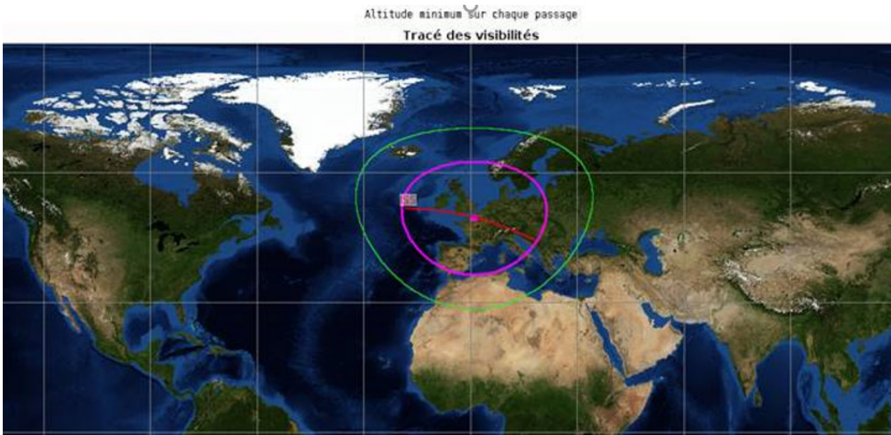
Carte de visibilité de l'ISS depuis Rouen le 24.05.2023 entre 20h47 et 20h54

Notons par ailleurs que le PAN est observé se déplaçant, selon le témoin, du nord-ouest ( 315^\circ ) au sud-est ( 135^\circ ) à des élévations successives de 35^\circ , 90^\circ et 45^\circ . Ces données sont très cohérentes avec celles fournies par le COSE : « visibilité de l'ISS depuis ROUEN allant du nord-ouest vers le sud-est, entre 20h47 et 20h54, avec une élévation maximale de 86^\circ ».