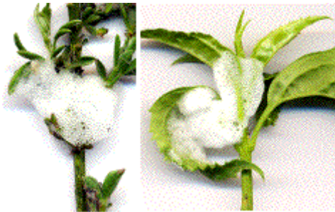
exemples de "crachats de coucou" sur genêt et forsythia

Pour ne rien vous cacher sachez que ce sont des "crachats de coucou", mais n'en déduisez pas pour autant que l'oiseau en question se conduit décidément fort mal, lui qui par ailleurs se complait déjà à squatter sans vergogne le nid d'autrui. En fait, page entomologique oblige, le coupable est bel et bien un insecte et en l'occurrence une Cicadelle, proche parente de nos bien connues cigales (voir page entomo). A ce titre l'une et l'autre sont d'ailleurs classées dans les Homoptères, Ordre d'insectes piqueurs-suceurs caractérisés par des ailes antérieures entièrement cornées et par le fait assimilables aux élytres des coléoptères.