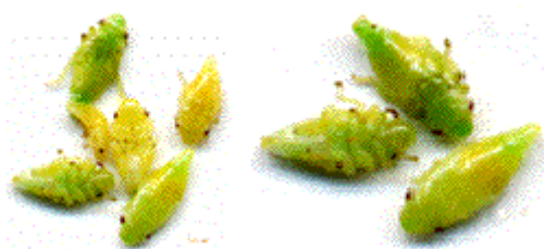
Larves a différents stades de leur développement

L'insecte adulte est de petite taille, de l'ordre du centimètre, et il est doté d'un rostre qui lui permet de perforer les végétaux pour se nourrir de leur sève. La larve se sustente à l'identique et vit au sein d'un amas spumeux communément appelé "crachat de coucou". Pour faire simple disons que les excréments de la larve sont à la fois liquides et visqueux, et que la larve en question y pulse de l'air pour former ce "crachat" où elle va se développer jusqu'au stade adulte. Etant très fragile, elle y trouve une relative protection contre les prédateurs mais surtout l'hydratation permanente qui lui est nécessaire, les bulles d'air assurant par ailleurs une régulation thermique tout aussi indispensable et efficace. Par référence à la bionique (étude de processus biologiques en vue de leur transposition à des fins industrielles), on pourrait dire que la frêle cicadelle a découvert bien avant l'homme le principe et les propriétés isolantes des mousses alvéolaires.